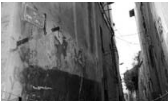
El carrer del Pont Trencat d'Avinyó, on al segle XV hi havia el prostíbul (Fotografia de Didier Boisseuil).

dreu i multipliqueu-vos i ompliu la terra i senyoregeu-la i domineu els peixos de la mar; els ocells del cel i tots els rèptils que s'arrosseguen per la terra») utilitza un argument propi dels heretges seguidors d'Epicur, el filòsof que va defensar l'amor carnal com un dels béns suprems, segons Francesc Eiximenis (Renedo 1994). Per demostrar que la monja en qüestió ha voltat molt, Jaume Roig amplia una frase proverbial, «córrer la Seca i la Meca i la Vall d'Andorra» amb topònims de la seva collita. La Seca i la Meca són els noms de dos castells propers. El primer és el castell d'Ars, anomenat la Seca i que es troba a la comarca de l'Alt Urgell. El segon és un castell andorrà, situat prop d'Ordino. Si Vila-seca i Santa Creu no es poden identificar amb exactitud ja que hi ha diversos indrets als quals correspon la nomenclatura, la Volta d'en Torra i el Pont Trencat fan referència, sense cap mena de dubte, a dos prostíbuls públics de dues ciutats importants. Com hem vist més amunt, la Volta d'en Torra és un dels bordells de Barcelona. El Pont Trencat és el prostíbul d'Avinyó, la ciutat dels papes que Petrarca anomenava la Babilònia de l'oest. El bordell d'Avinyó es trobava agrupat al voltant de diversos carrers que envoltaven una placeta amb arbres (Rossiaud 1986: 13), prop del Pont Trencat que als segles XIV i XV comunicava amb la vila nova (Pansier 1979: 181). Consta l'existència a Avinyó d'una casa de banys que duia el mateix nom (Rossiaud 1986: 14).