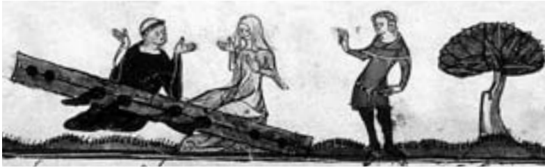
Un cavaller castiga la seva dama pel seu comportament descortès durant la confessió (Londres, British Library).