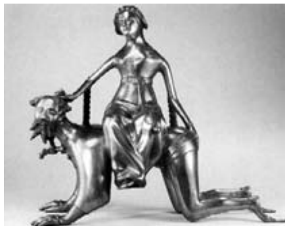
Estatueta d'Aristòtil cavalcat per una dona (Nova York, Metropolitan Museum of Art). Un dels arguments utilitzats en el debat sobre la condició femenina a la literatura és que les dones són capaces de fer cometre a un home, fins i tot al més intel·ligent, qualsevol bogeria. En aquests textos corria la llegenda que Aristòtil s'havia deixat cavalcar per una amant d'Alexandre Magne.