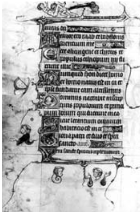
Escena sexual al marge d'un llibre d'hores (Nova York, Pierpoint Library).

A l'Edat Mitjana, tant les autoritats civils com les religioses acceptaven la prostitució com un fet necessari, imprescindible per vehicular ordenadament la sexualitat masculina i, alhora, per protegir les dones decents de l'agressivitat desbocada dels mascles (Flan-