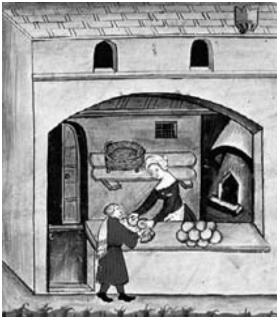
Una fornera despaxant la mercaderia al Tacuinum sanitatis (Viena, Österreichische Nationalbibliothek). Les dones que exercien aquest ofici tenien fama de dur una vida dissoluta.

Considerar que les dones, des dels temps d'Adam i Eva, són les úniques culpables de tots els pecats sexuals és un dels arguments més utilitzats pels anti-feministes que participen en el debat sobre la condició femenina. La literatura ha condemnat les dones per això des de la sàtira VI de Juvenal, escrita entre l'any 100 i el 127. El poeta romà afirma que les dones són insaciables sexualment, i aquest és un dels molts motius que aconsellen l'home genèric de no casar-se mai. Ho diu amb un vers que ha esdevingut cèlebre: l'esposa de l'emperador Claudi, que a les nits fugia del llit imperial per anar a fer de prostituta sense que la pogués reconèixer ningú, acabava sempre a la matinal «fatigada pels homes, però no associada» (Juvenal 1961: I, 104).