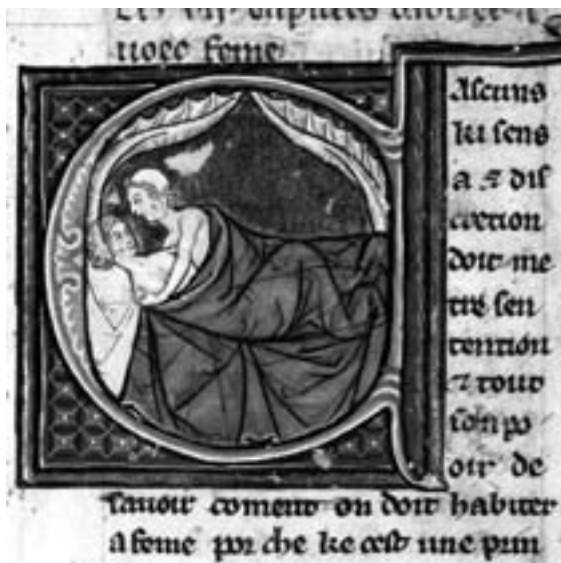
Els regiments de sanitat dedicaven uns capítols a les relacions sexuals, beneficioses per a la salut ( Regiment del cos d'Aldobrandino de Siena, Londres, British Library).

seguit que s'havien de canalitzar pulsions sexuals tan violentes i aquest va ser un dels motius que els va induir a crear els prostíbuls municipals a començaments del segle XIV. Certament, la majoria de les ciutats medievals tenien un prostibulum publicum , construït, mantingut i regentat per les autoritats municipals perquè s'havien adonat que la prostitució era tan essencial com les clavegueres. 2