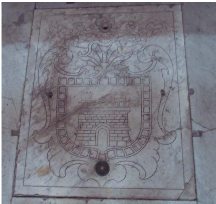
Llosa del vas sepulcral de la capella d'Ávalos de Sant'Anna dei Lombardi a Nàpols.

del segle XVI, com escriu. Per més lliçons heràldiques que Soler faci aparença de donar, quan hom comprova alguna dada d'aquestes, les seves propostes s'esfumen. Sobre la llosa del vas funerari de la capella d'Ávalos, on fou sebolit Íñigo d'Ávalos segons la Crònica de notar Giacomo, figuren les armes del llinatge d'Ávalos: una torre amb tres torretes merletades. Aquestes armes no es troben a la novel·la i, d'altra banda, Curial usa diversos senyals heràldics.