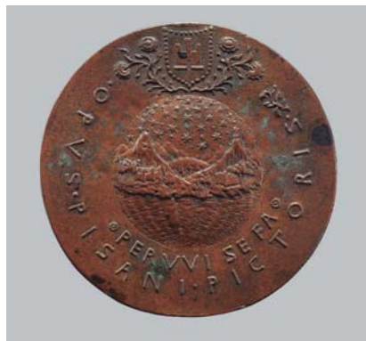
Anvers i revers de la medalla d'Íñigo d'Ávalos feta per Pisanello.